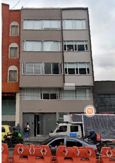
IMAGEN DEL APLICATIVO GOOGLE STREET VIEW 2025