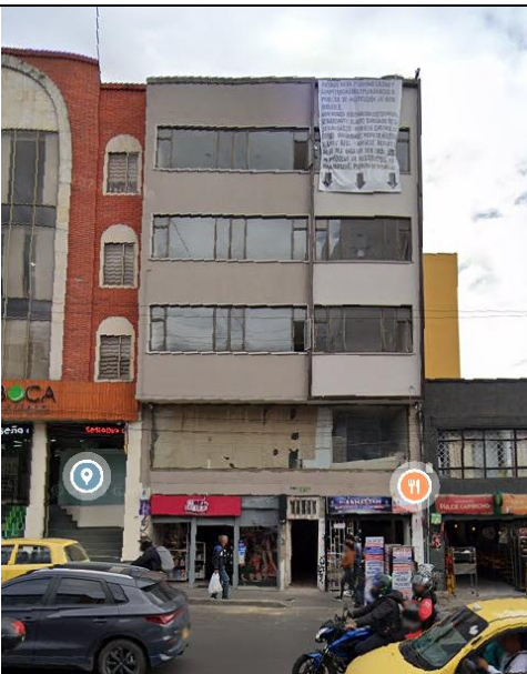
IMAGEN DEL APLICATIVO GOOGLE STREET VIEW 2023