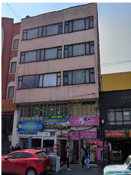
IMAGEN DEL APLICATIVO GOOGLE STREET VIEW